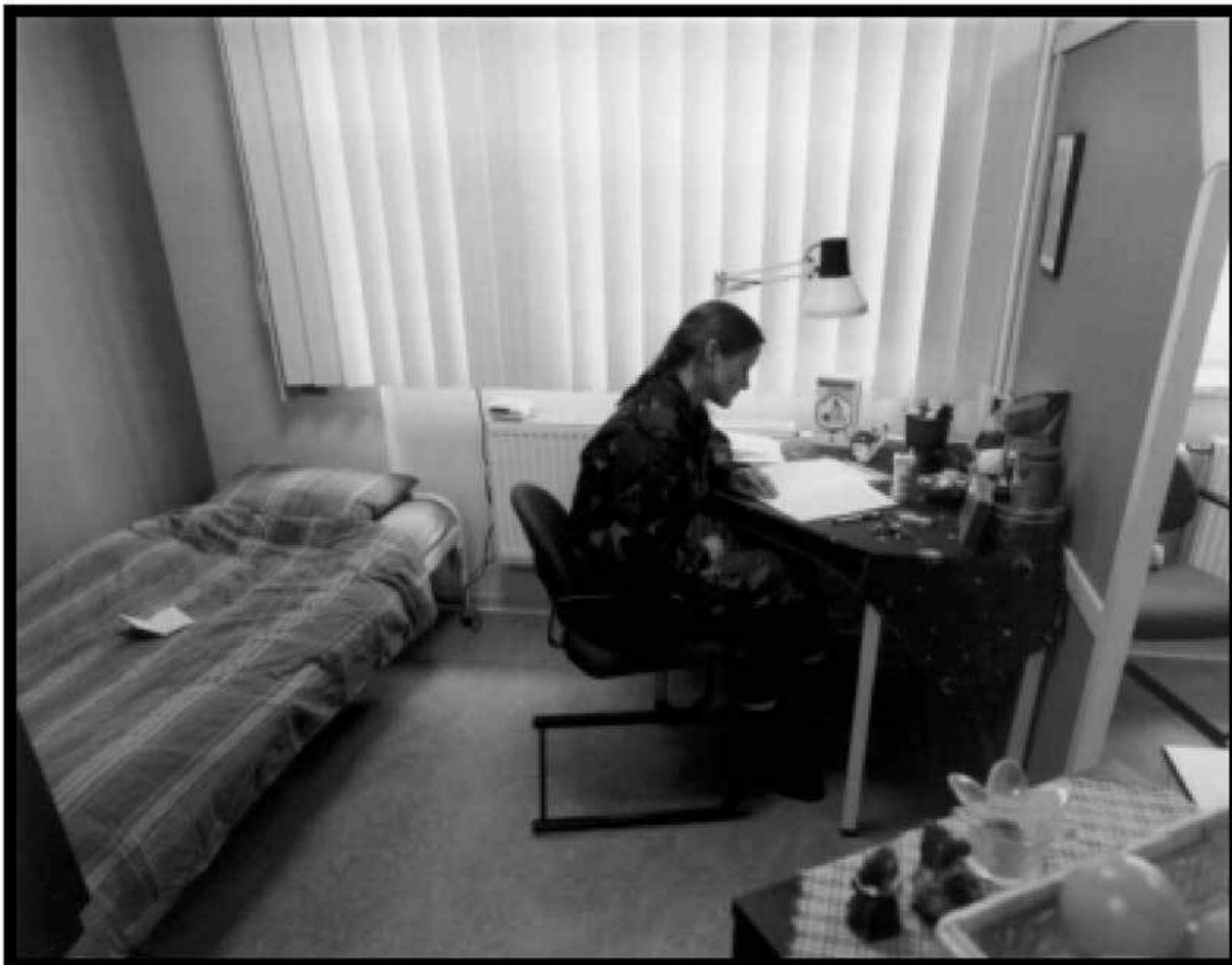
LEGERINGSKAMER IN CLUSTERWONING

Wanneer op de kazerne geen legeringsmogelijkheid voorhanden is, kunt u worden ondergebracht in flatappartementen in Zeven. Dergelijke appartementen bewoont u afhankelijk van de grootte met twee of drie mensen.